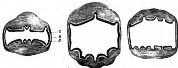
Figur 5-7. Querschnitte durch die Magen dreier erwachsener Silbermöven. C Cuticula, D Dittensauschnitt und S Schnapsgrübel.

Um weiteres Material zur Beurtheilung dieser Variabilität zu erhalten, liess ich mir durch die biologische Anstalt auf Helgoland einige Silbermöven ( Larus argentatus ) schicken. Ich bekam vier statt-